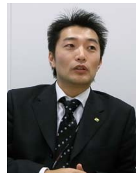
地道な「お客様目線での行動」の積み重ねが、信頼関係の基盤となります

PowerPointファイルの圧縮も、このような行動と同じです。お客様の立場で、重いファイルを受け取ったらどう感じるかを考えます。…決していい気分にはなりませんよね。