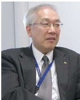
「こんなに軽くなるんだね」と、お客様に喜ばれた営業担当者は大勢います

まず、NXPowerLiteの圧縮比率の高さに感心しています。初めて体験版を使ったとき、3MBのPowerPointファイルが数百KBまで圧縮されたのには驚きました。