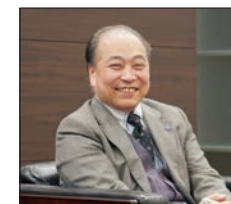
* NXPowerLite は一括導入するほうがメリットを最大化できると感じています。

確かにそのような形で口コミで広がっていったほうがいいツールやソフトウェアもありますが、NXPowerLite については以下のような理由で「一括導入が望ましい」と判断しました。