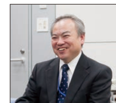
* Office を使い慣れている限り、NXPowerLite は欠かせないツールです。

（注：NXPowerLite デスクトップエディションの Office 2013 対応は 2014 年春頃を予定しています）