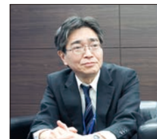
* 外出先からモバイル回線でファイルの送受信を行う営業担当者は、特に苦労していました。

その結果、送信するためにわざわざファイルを複数に分割したり、CD-ROM に焼いて届けたりといった作業が必要となり、営業現場の業務効率さが下がっていました。