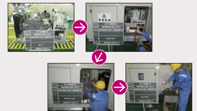
資料に盛り込まれる画像データの例。

上：少ない力で重い物の運搬を可能にするパワーアシスト台車 下：ディーゼル発電装置の設置から耐電圧・過回転耐力等の各種試験までのプロセス